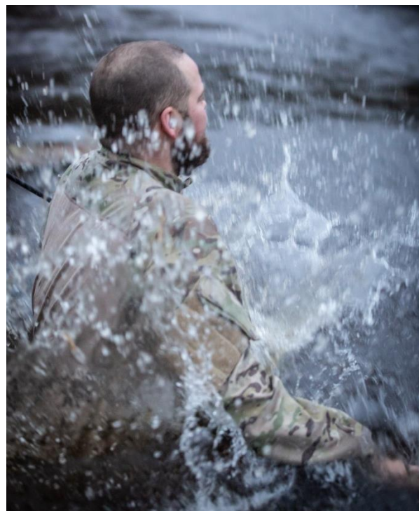
Vintertræning, isen var tynd.

kaserne. Og så er der selvfølgelig ”kuffen”, hvor medarbejdere fra KFUM hurtigt fik etableret en dejlig duft af kage samt en blød sofa til de hårdarbejdende soldater.