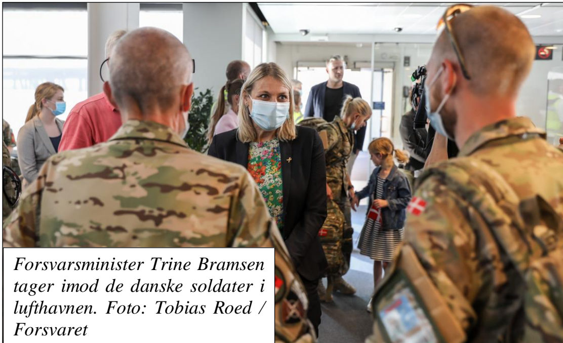
Forsvarsminister Trine Bramsen tager imod de danske soldater i lufthavnen.

”Det er næsten 20 år siden, at vi fulgtes med vores allierede i NATO og USA ind i Afghanistan efter terrorangrebet 11. september 2001. Mere end 12.000 danske soldater har kæmpet i Afghanistan mod militant islamisme. De har ydet en stor og vigtig indsats, for at vi herhjemme fortsat kan leve trygt og med vores demokratiske frihedsværdier. Vi skylder hver eneste af de udsendte stor respekt og tak for indsatsen. Selvom vi ikke længere har militær tilstedeværelse i Afghanistan, så fortsætter kampen mod terror andre steder i verden. Men tiden er nu kommet til at sige ’velkommen hjem og tak for indsatsen’ til de danske soldater fra Afghanistan,” siger forsvarsminister Trine Bramsen.