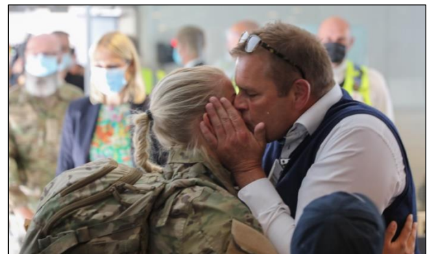
Gensynsglæde i Kastrup Lufthavn.

dater, der landede i Kastrup i dag, fløj hjem med et civilt fly.