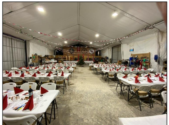
Vi er klar til juleaften! 24. dec 2019, i værkstedsteltet på Al-Asad Airbase.

Angrebet fik os dog ikke til at stoppe med træningen af de irakiske sikkerhedsstyrker. Det standsede heller ikke vores festligholdelse af julen. Vi gennemførte en række juleaktiviteter i løbet af december, afsluttende med flæskesteg og roast-beef juleaften, som vi holdt i vores værksted for over 200 soldater. Både jul og nytår blev fejret på bedste vis, selvom nytårsaften 2019-2020 var lidt speciel (vi var på højt beredskab, så vi havde tilbragte dagen i fragvest og gik tidligt i seng).