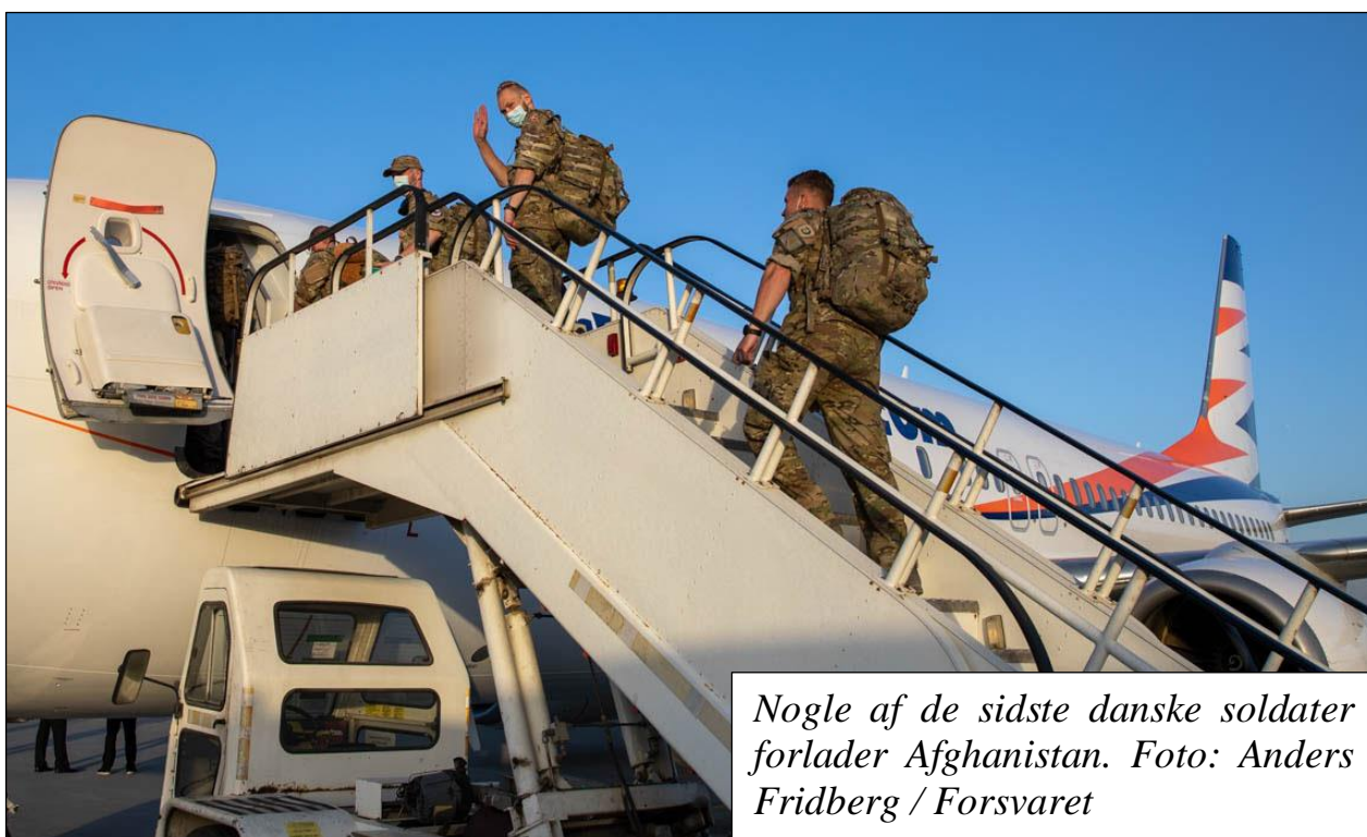
Nogle af de sidste danske soldater forlader Afghanistan.

De sidste danske soldater har i dag forladt Afghanistan. Det første fly med soldater landede i Kastrup tirsdag og senere lander et Hercules-fly med de sidste danske soldater fra Afghanistan i Karup. Dermed er Forsvarets engagement i Afghanistan afsluttet.