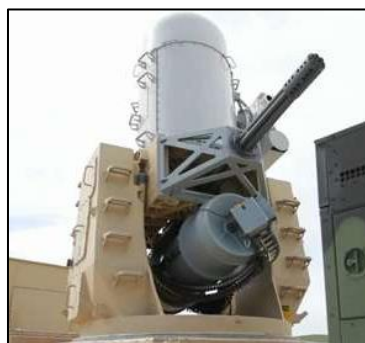
CRAM – Counter Rocket Artillery Mortar Protection System

Efterretningsofficerens varsel fra tidligere, viser sig at have holdt stik. IDF-alarmerne går i gang, med sin høje hyletone og meldingen om "INCOMING INCOMING INCOMING". Der bliver slukket cigaretter og film sat på pause, mens udrustning bliver på krympet og soldaterne forsøger at snige sig til et glimt af CRAM'en, der skyder raketterne ned.