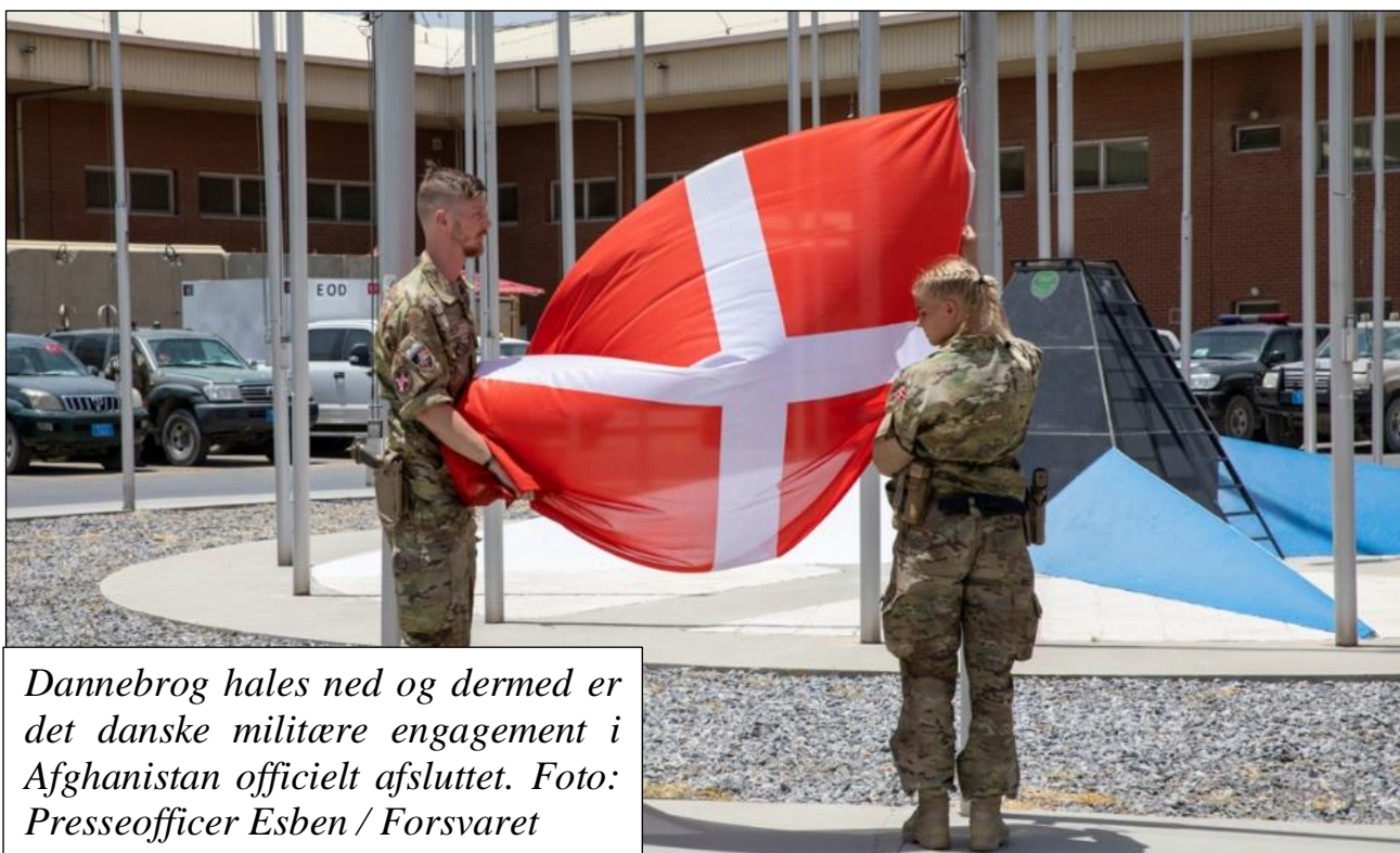
Dannebrog hales ned og dermed er det danske militære engagement i Afghanistan officielt afsluttet.

Forsvarets sidste flag i Afghanistan blev taget ned ved en ceremoni i Hamid Karzai International Airport North mandag den 21. juni.