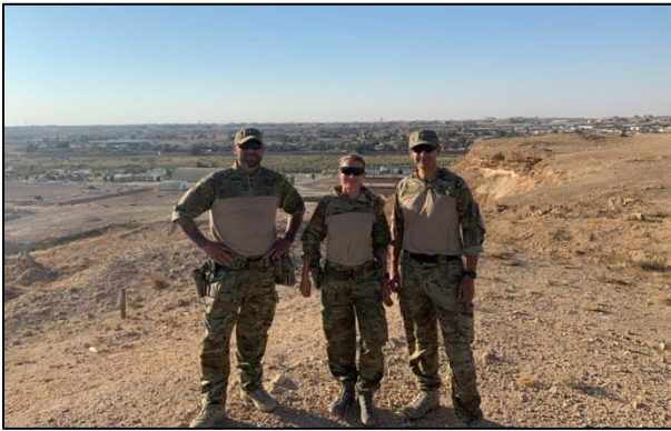
Forfatteren (til højre) sammen med Jesper og Tilde, d. 31. juli 2019 nord for Al-Asad Airbase

Truslerne mod basen bestod primært af beskydning med raketter og morterer, men vi kunne ikke udelukke angreb med mindre landstyrker eller beskydning med kemiske våben. Det er klart, at angrebene på andre koalitionsbaser i Irak i samme periode var med til at underbygge vores samlede billede af, at vi nok ikke kom tilbage til at kunne arbejde i fred og ro lige foreløbig.