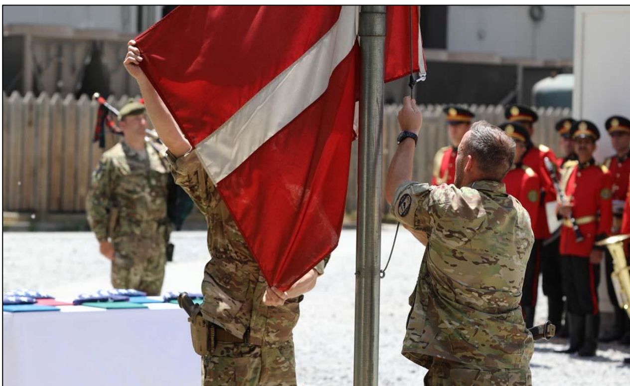
NATO overdrager i maj 2021 New Kabul Compound til de afghanske sikkerhedsstyrker.

skolen kunne vende tilbage igen. Det betød, at de danske rådgivere på officersskolen i september 2020 kunne fejre en vigtig milepæl, da kadet nummer 5000 var færdiguddannet. Efter syv års indsats reducerede danskerne og andre nationer deres støtte til skolen og overlod det til deres afghanske kolleger at føre arbejdet videre.