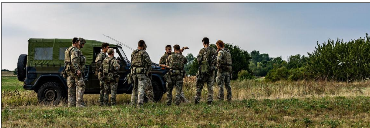
Soldaterne og deres instruktører, der tidligere har været udsendt til missionen i Irak, evaluerer efter gennemførelse af en handlebane.

Soldaterne blev på den sidste øvelse blandt andet udsat for forskellige scenarier, hvor de skulle finde og neutralisere improviserede sprængladninger (IED), som fjenden har skjult langs ruten, hvor soldaterne kører