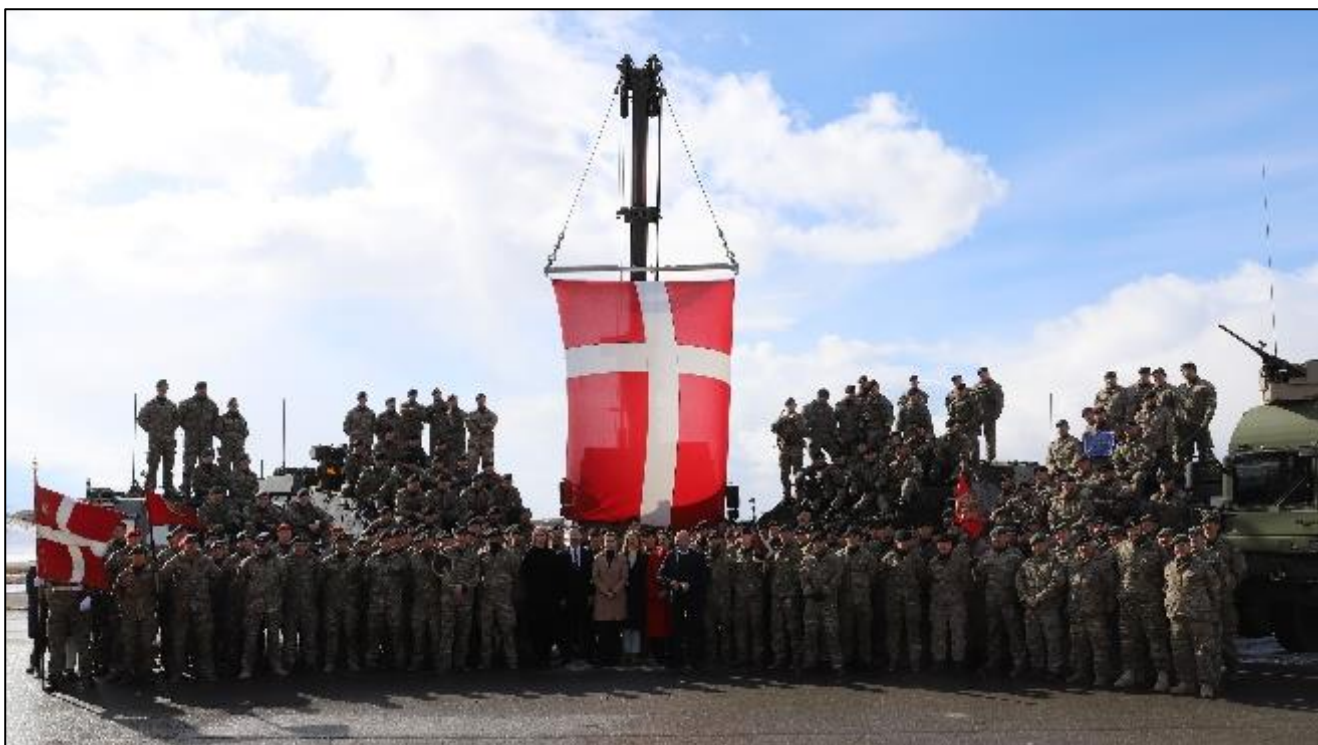
Statsminister Mette Frederiksens besøg ved DANCON eFP-5, marts 2022

Statsminister Mette Frederiksen og de fire partiledere bag den nye forsvarsforligsaftale var på besøg på Tapa Kaserne i marts. Statsministeren mødtes med sin estiske kollega, premierminister Kaja Kallas, der har nogle meget klare budskaber vedrørende, hvad hun og Estland betragter som truslen fra Rusland. Vi fik vist dem rundt i vores bygning. De fik også mulighed for at ridse deres navne i ruden til KFUM-soldaterhjemmet, en ældgammel tradition, som har fulgt med os rundt i alle missionsområderne. Og så fik de smagt den hjemmebagte kage og talte med mange af soldaterne.