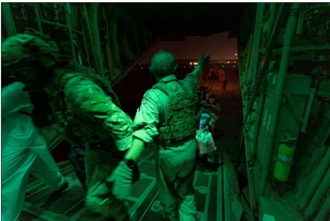
Foto fra evakueringen af afghanere, der har samarbejdet med danske myndigheder, fra Kabul i Afghanistan til Islamabad i Pakistan. Evakueringen foregik i et Hercules-taktisk-transportfly.

Talebans hurtige magtovertagelse betød, at den danske regering