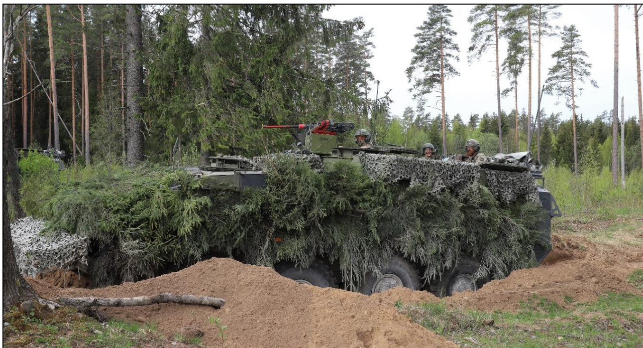
Gravet ned og klar til kamp

fællesspisning, med burgers og kage for hele kampgruppen og i dagens anledning blev den restriktive ”Two can” alkoholpolitik hævet til ”Four can”.