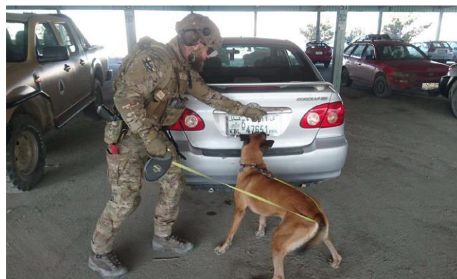
Hundefører med hunden Otto på opgave i den afghanske base ved Hamid Karzai International Airport.

Support med officerer ved missionens hovedkvarter, et sikrings- og eskortebidrag, en styrke fra militær-