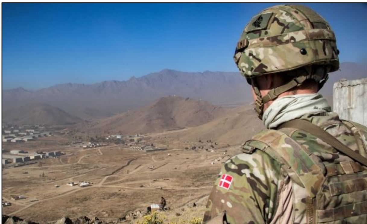
Danske soldater underviser elever på officersskole i Afghanistan.

Artikel er fundet på Forsvarets hjemmeside.