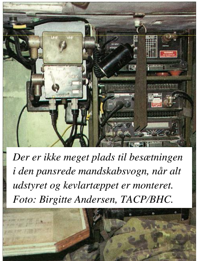
Der er ikke meget plads til besætningen i den pansrede mandskabsvogn, når alt udstyret og kevlartæppet er monteret.

Det lykkes imidlertid hurtigt SISU'en at bjærge det evakuerende køretøj med besætning, og den er tilbage i sikkerhed. før de sidste fly ankommer. Da AOCC fik denne melding, blev der givet tilladelse til, at FAC kunne anvende flyene til træning over egne linjer. Det sidste, der ses fra køretøjet, da det forlader området efter endt undsætning, er fire fly, der foretager simulerede angreb over konfrontationslinjen.