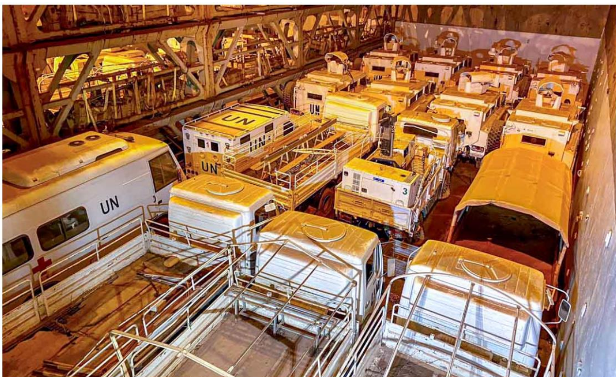
FN køretøjer på vej fra FN-missionen MINUSMA.

Forsvaret skal fragte over 600 FN-køretøjer, trailere og containere ud af Senegal, i forbindelse med at FN har afsluttet sit engagement i Mali. En opgave, der understreger Danmarks engagement i FN og internationalt samarbejde.