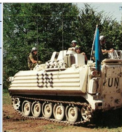
TACP-team klar i venteposition.