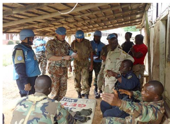
På patrulje ved grænsen

Sproget i Liberia er engelsk, men det er liberiansk-engelsk og det er ikke så let at forstå, specielt ikke hvis de bliver ivrige. Desuden er der en hel del forskellige stammesprog. Derfor er der på patruljerne, foruden de normalt 2 FN observatører, en lokal tolk, der behersker liberiansk-engelsk samt det stammesprog, der tales i området eksempelvis Krahn eller Bassa. De patruljer vi kører varer fra 1-8 timer alt efter hvor langt væk man skal og ikke mindst vejenes tilstand. Det er meget hårdt ved bilerne, så pga. hyppige reparationer er der altid mangel på biler ved Team Siten.