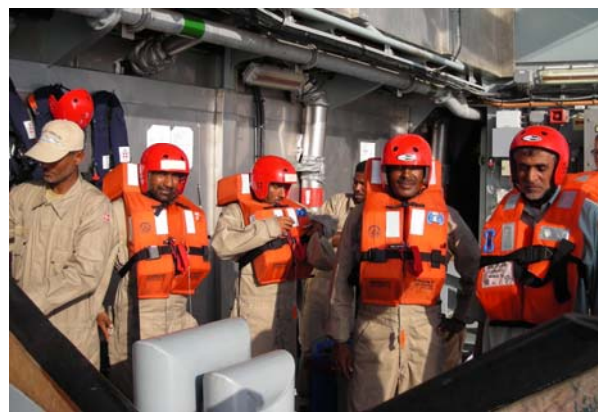
Frigivne gidsler klar til at fortsætte på egen båd

Efter frigivelsen af gidslerne kunne ABSALON i januar 2012 sejle mod Port Victoria på Seychellerne og en anden besætning kunne overtage såvel skib som de tilbage holdte pirater. Den næste besætning, kunne føje adskillige pirater og et par moderskibe til samlingen.