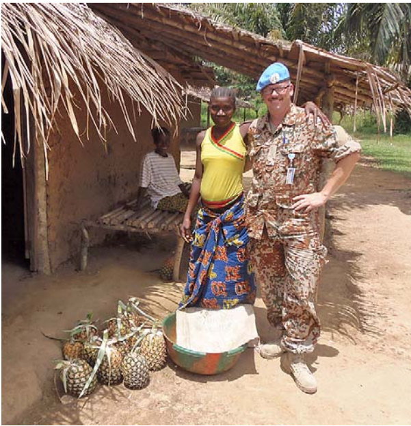
En lokal ananassælger

I Zwedru spiste vi frokost i den pakistanske lejr. Det var ganske god mad, men de gange jeg var på leave i Danmark, var der forbud mod ris og kylling. I Buchanan har vi en lokal mand til at lave frokost til os. Vi køber varerne og han laver det mad, han finder på. Her er der mere afveksling i menuen. Her er også andre muligheder, nemlig at købe frisk fisk, store rejer, languster mm. direkte fra fiskerne og til ganske rimelige priser og så nyder vi de mange store ananas, papaya, bananer og mangofrugter, vi kan finde på vores patruljer.