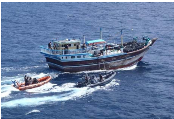
Tahiri bliver stoppet.

Årsagen til at disse pirater kan dømmes er, at de kan knyttes til en udført pirat handling, nemlig kapringen af Tahiri.