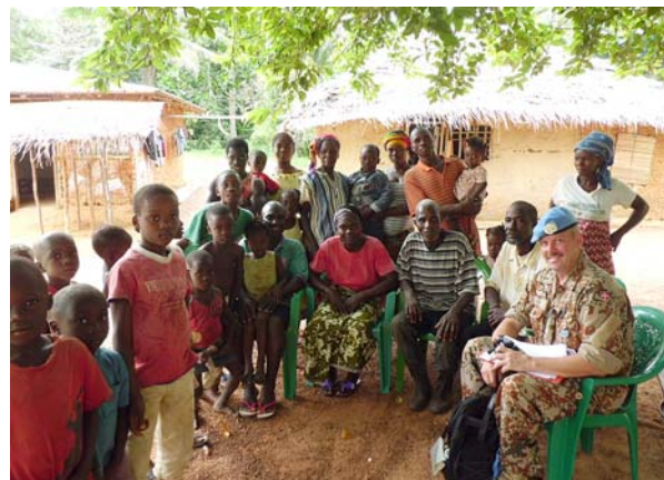
På en landsbypatrulje

Vi kørte mange patruljer, hvor vi besøgte landsbyer ude i junglen og her talte vi med beboerne og monitorerede stemningen blandt lokalbefolkningen samt i de mange guldminer (legale og illegale), der er i området. Team Siten gennemfører hver dag 3 patruljer, så der gennemføres altså mere end 1.000 patruljer om året ved hvert Team Site.