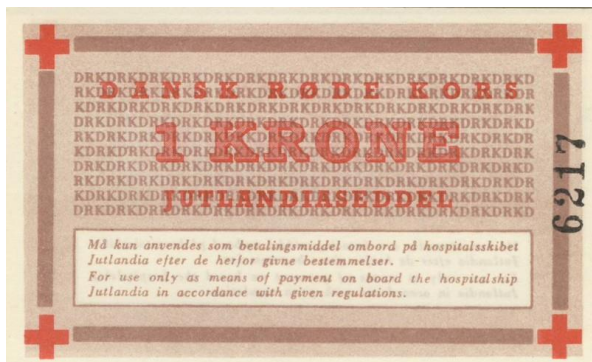
Gangbart betalingsmiddel om bord.

Vi kunne derfor ikke umiddelbart forlade skibet. De to første hold, der havde været af sted med Jutlandia, havde ligget ved kaj ved Pusan, og de kunne gå i land.