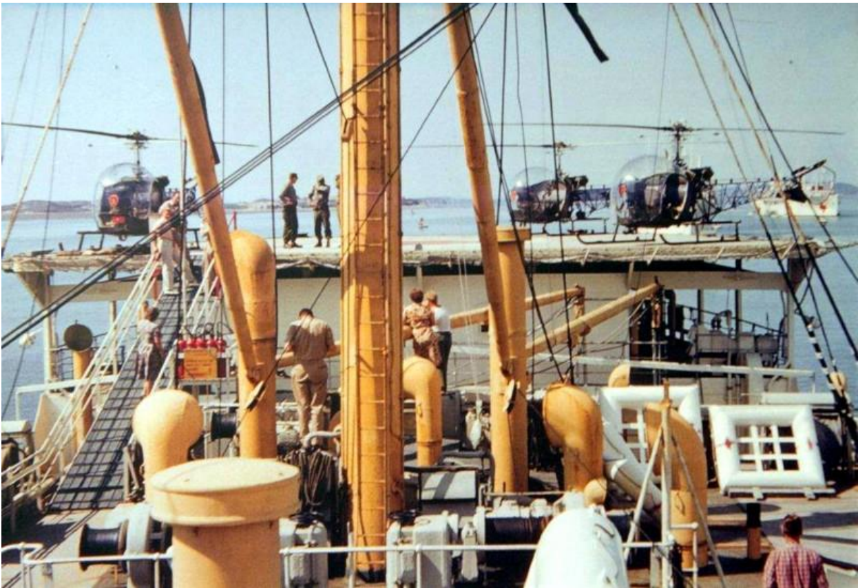
Vue agterud til helikopter platform.