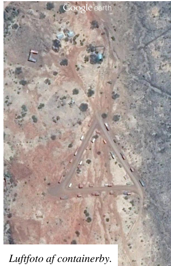
Luftfoto af containerby.

Da vi ankom til lejren, indrettede vi os i tilknytning til en opstillet kullisseby, lavet af 20 fods containere, lidt i stil med "Brikby"