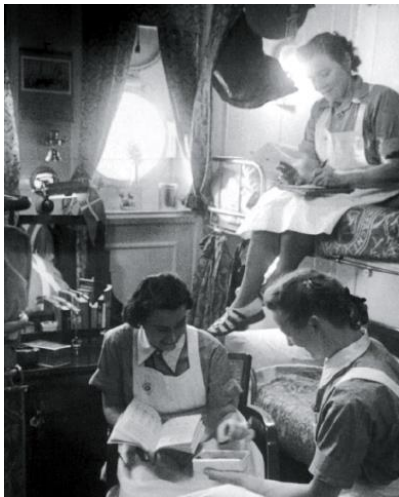
Sygeplejerskerne på Jutlandia havde trange vilkår i deres gemakker.