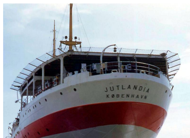
Jutlandias flotte hæk.

Jutlandia blev efter hjemkomsten igen ombygget og genoptog sejladsen som kombineret fragt og passagerskib. Det blev ophugget i 1965.