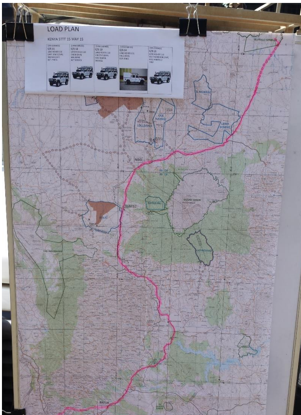
Turen fra Nairobi til træningsområdet.

ISIOLO ca. 400 km nord for Nairobi, dvs. på den nordlige side af Mt Kenya og ækvator.