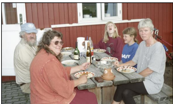
Kustode frokost en varm sommerdag

Tak til alle de gode mennesker, som beredvilligt har været kustoder i de ti år, hvor jeg har haft fornøjelsen af at være kustodechef. Selv har jeg været kustode hvert år siden 1992, hvor vi havde den første udstilling