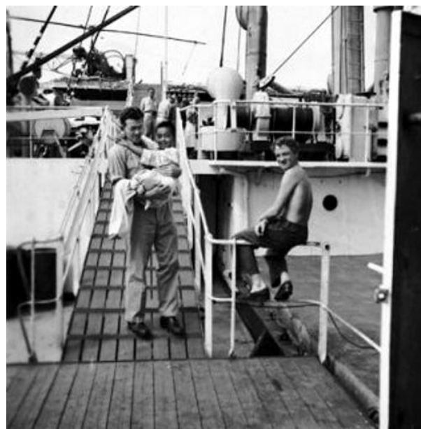
Her ses en smilende dreng selv om han lige har mistet sit ene ben.

De færreste tænker nok på, at der blev dræbt lige så mange amerikanske soldater på tre år i Koreakrigen, som der blev dræbt på 10 år i Vietnam, siger han. I alt krævede Koreakrigen knap tre mio. døde og over tre mio. sårede.