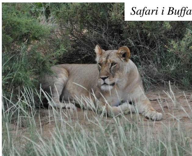
Safari i Buffalo Springs.

dage vi boede på savannen så vi dog ikke skyggen af regn og dagstemperaturen steg løbende fra 28 – 35 grader.