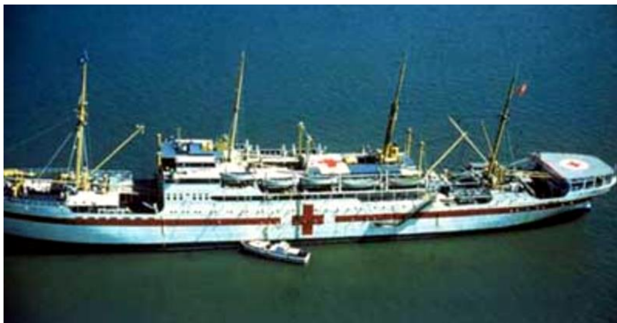
Hospitalsskibet Jutlandia ses her under sit 3. togt til Korea.

Skibet forlod Langelinie første gang 23. januar 1951 og kom hjem for tredje og sidste gang den 16. oktober 1953.