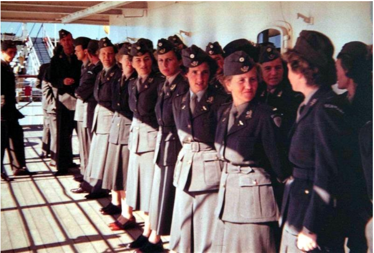
Sygeplejersker ved ankomst.